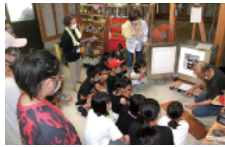
6日目(7/29)に窯びらきメダルが焼き上がりました