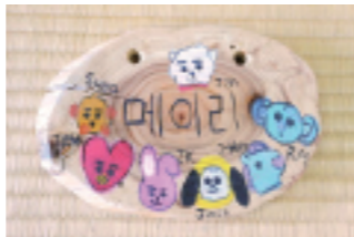
毎回の夏休み寺子屋でしている「木の工作」。今回は木の壁飾りと、料理箸（ご家庭への子ども寺子屋記念）・コースターなどを制作しました。