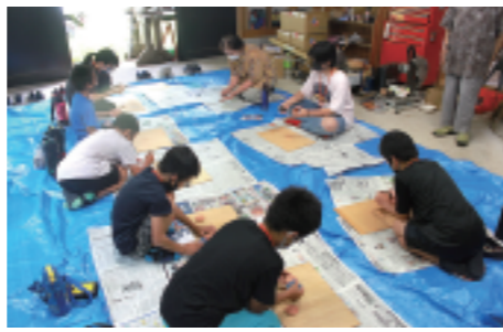
2日目(7/23)・3日目(7/26)素焼きしたメダルに絵付け

「子ども寺子屋」は、子どもたちの夏休みの「まなび」と「あそび」の場としてだけでなく、地域の子どもたちと門徒（地域住民）とがお寺で一緒にふれあう場としても、年々発展しています。 今回も、夏休み前にスタッフが集まり、工作の内容や手順、朗読の担当者決め、感染対策などの話し合いを重ねて、一緒に準備をすすめてまいりました。