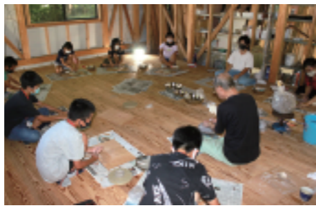
4日目(7/27)・5日目(7/28)粘土からマグカップの形づくり