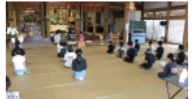
▲朝のつどいは本堂でお参り。 ▼スタッフの方にアドバイスをもらいながら工作。